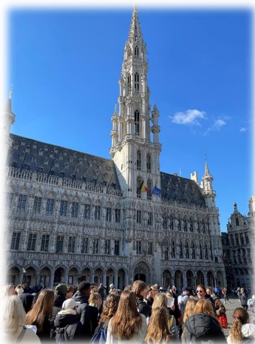
Culturele uitstap: Brusseldag 2023

Heb je nog vragen over het kiezen van de studierichting die bij je past? Twijfel je of je wel de goede keuze maakt? Aarzel dan niet om contact op te nemen met je klassenleraar, een vakleerkracht, de KLb op school (Kern Leerlingenbegeleiding) of het CLB, of met de directie.